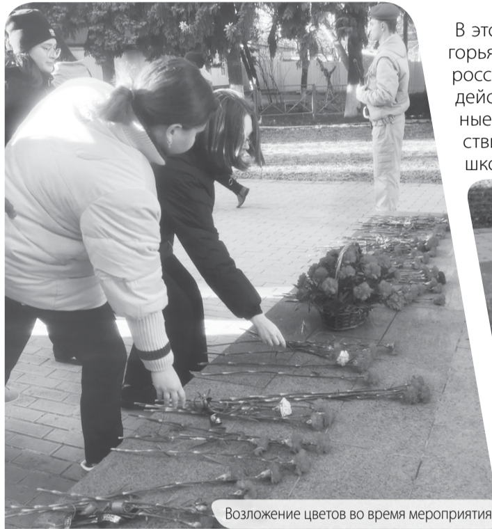
Возложение цветов во время мероприятия.

В этот памятный день в населённых пунктах Предгорья прошли масштабные мероприятия в память о российских и советских воинах, погибших в боевых действиях – митинги, возложение цветов, классные беседы, встречи с участниками боевых действий, посещение залов Боевой и Трудовой Славы, школьных музеев.