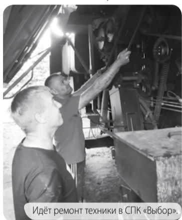
Идёт ремонт техники в СПК «Выбор».

Сельхозтоваропроизводители Предгорного муниципального округа подводят итоги первого месяца подготовки машинно-тракторного парка к весенним полевым работам.